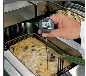
Kontrola v oblasti potravin (HACCP)